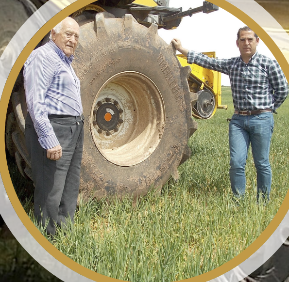
● Los Martínez: García (padre, a la izquierda) y Ortega (hijo, a la derecha)

La cosechadora New Holland CX8070 de Sotero trabaja con unos Trelleborg TM3000 IF 800/70R32 CFO, con tecnología BlueTire™, que respeta el suelo y aumenta la productividad de los cultivos.